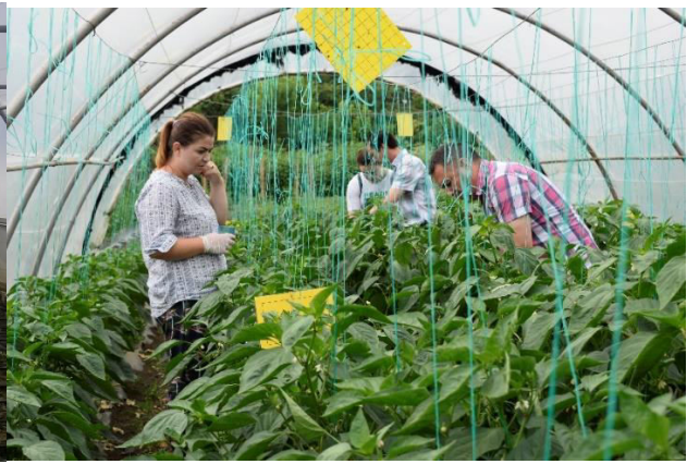
CÂMPUL LEGUMICOL, SOLARIILE