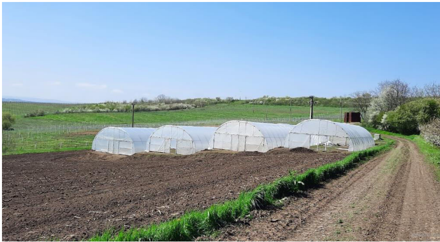
COMPLEXUL DE SOLARII