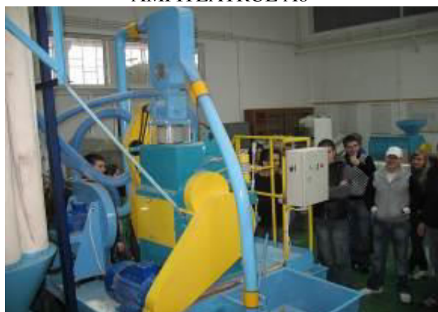
BAZA ENERGETICĂ ȘI MECANIZARE