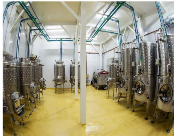
STAȚIA ȘI LABORATORUL DE VINIFICAȚIE