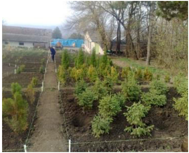
COLECȚII PLANTE FLORICOLE ȘI DENDROLOGICE