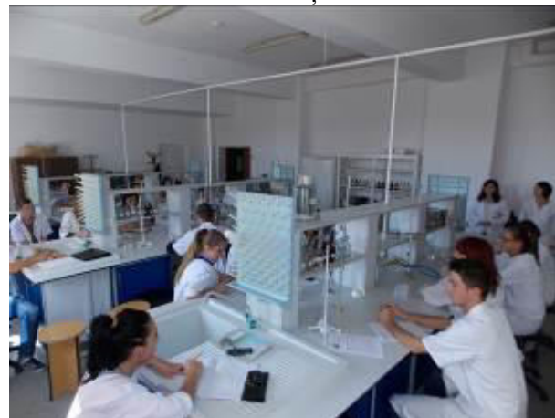
CHIMIE ȘI BIOCHIMIE I